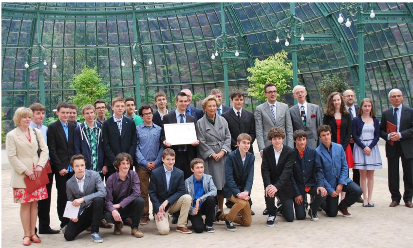
De laureaten mochten in de Leopoldserre samen op de foto met de koningin en de Minister van Onderwijs

welbevinden van elke leerling, gingen de sterkere leerlingen zich ontfermen over de minder sterke, die op die manier een M@thM@te toegewezen kregen. Tijdens speciaal georganiseerde middagsessies kwamen beide groepen samen tot een grondige