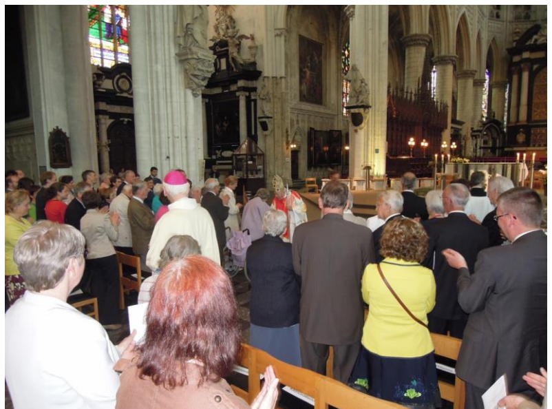
Viering Kardinaal Danneels in de Sint-Romboutskathedraal (boven) en receptie in het Bisdom (foto links)