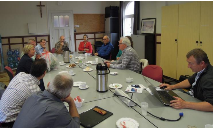
De directeurs van het Koninklijk Instituut Woluwe gaven uitleg over de werking van de basis- en secundaire school voor buitengewoon onderwijs en leidden ons rond (zie foto onderaan rechts)

Weinig katholieke scholen mogen zich koninklijk noemen. De school voor Doven en Blinden in Sint-Lambrechts-Woluwe, gerund door de Broeders van Liefde, mag dat wel. Ze heeft dan ook de eerbiedwaardige leeftijd bereikt van ruim 175 jaar. De pedagogische begeleiding van het buitengewoon onderwijs vond het een geschikte locatie om er op 13 juni 2013 een bezoek aan te brengen en om het werkjaar te evalueren.