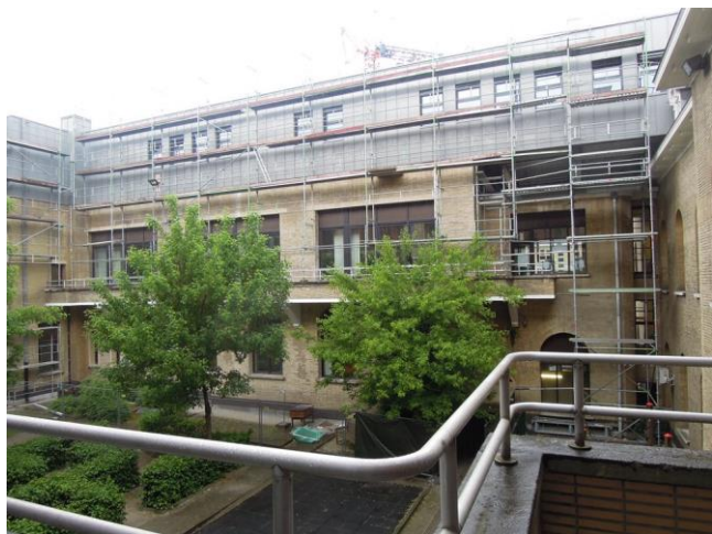
De verbouwingen zorgen voor de noodzakelijke uitbreiding.