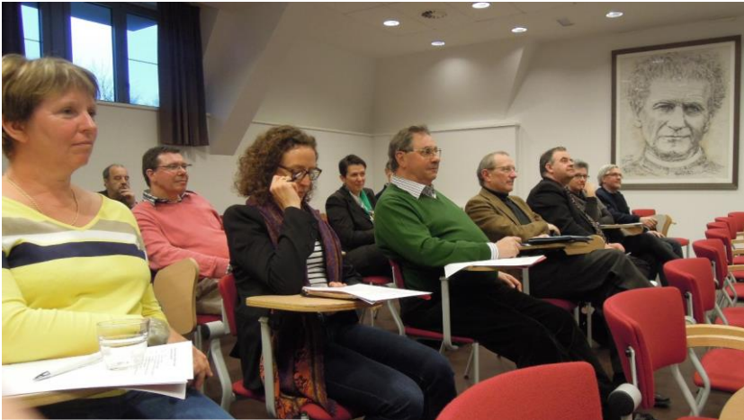
Een 8 ste etappe van de Ronde van schoolbesturen vond plaats op 16 april 2013 in het Don Bosco Onderwijscentrum in Oud-Heverlee

Verschillende sectoren in onze maatschappij zoeken naar synergieën en schaalvergroting om de huidige en toekomstige uitdagingen aan te kunnen. Het meest recente voorbeeld daarvan zijn de uitgevergroepen Corelio en Concentra, die een joint venture aangaan om op die manier elkaar te versterken en beter stand te houden en te groeien op de concurrentiële krantenmarkt. Ook schoolbesturen zullen wellicht niet kunnen ontsnappen aan dat soort evoluties, zij het niet helemaal om dezelfde redenen.